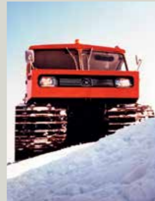
PB 120B 1969