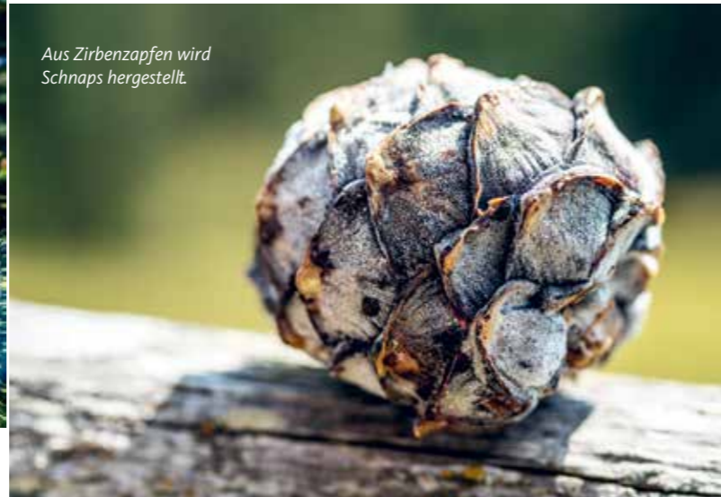
Aus Zirbenzapfen wird Schnaps hergestellt.