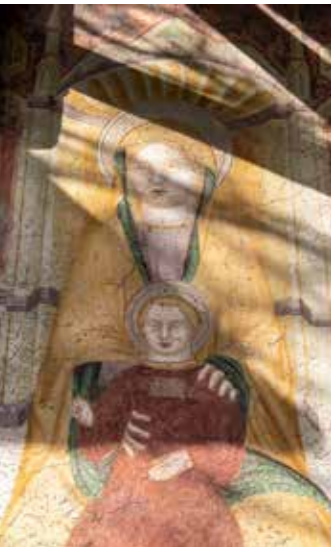
Ein Fresko der Außenwand aus dem 15. Jahrhundert zeigt eine Gottesmutter mit Jesus-Kind

Ein Stück Kirchengeschichte. Sicher ist, dass das Kirchlein erstmals in einer Urkunde aus dem Jahr 1244 n.Chr. erwähnt wird. In einer Güterschenkung wird ausdrücklich auf die Kirche hingewiesen, „auf dem Berg des Hl. Valentin“. Von dieser Urkirche besteht heute noch der romanische Turm. Dieser hebt sich mit den zwei Reihen Rundbogenfenstern eindeutig vom Rest des Baus ab. In den nachfolgenden Jahrhunderten gab es immer wieder Umbauten, Anpassungen an den Zeitgeschmack. Die ersten Fresken, die im Inneren der Kirche unter weiteren Malschichten entdeckt wurden, stammen aus dem 14. Jahrhundert, als die Kirche nach roma- »