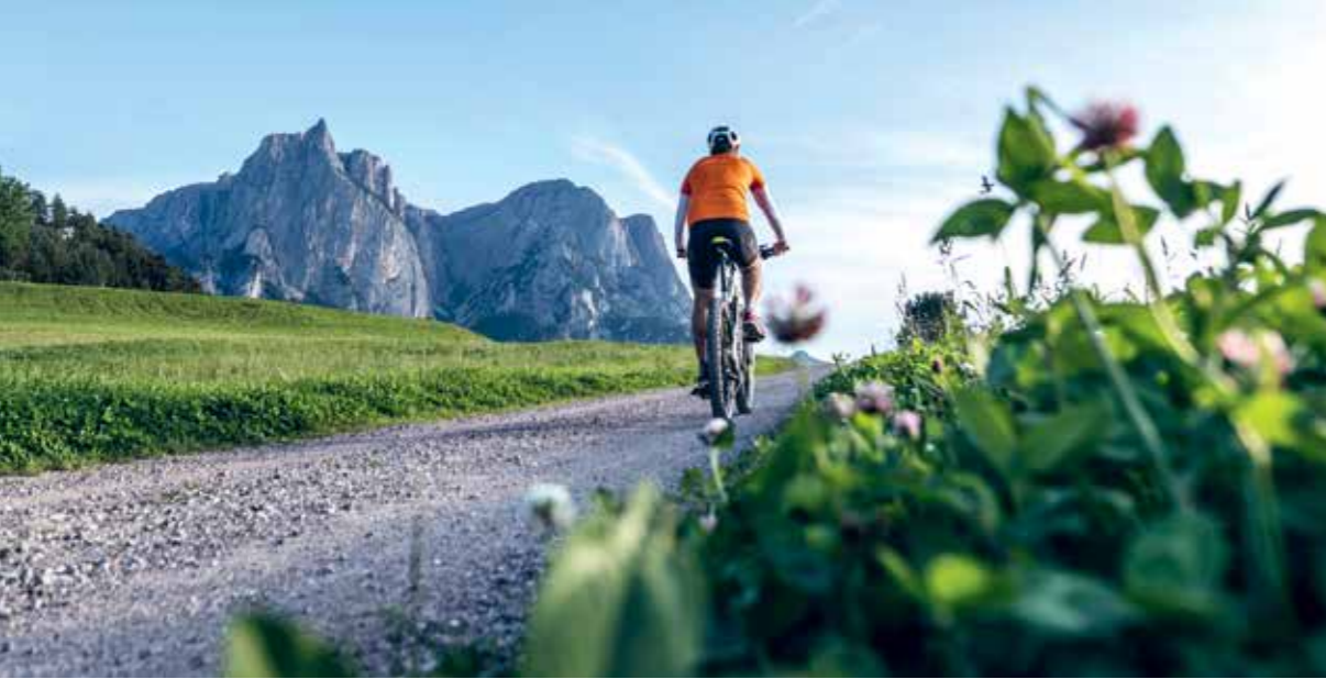
Die Seiser Alm ist ein Biker-Paradies, allerdings ist das Fahrradfahren nur auf breiten Forst- und Wanderwegen erlaubt.