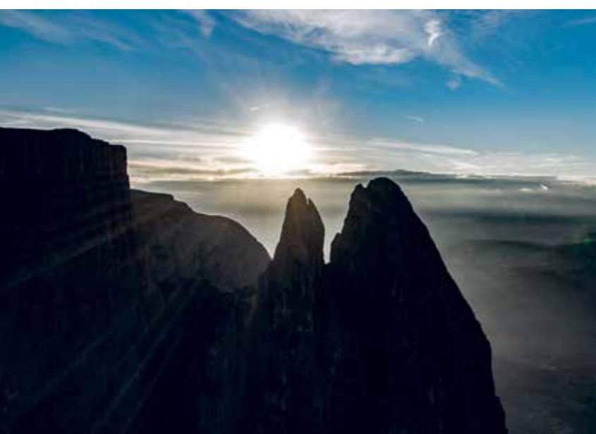
Die Dolomitengipfel sind unverwechselbar in Form und Schönheit, wie die Drei Zinnen, der Peitlerkofel im Naturpark Puez-Geister und der Schlern (von oben nach unten)

vor allem einen Vorteil im zukünftigen Marketing und witterten die Chance, Südtirol für den Tourismus noch attraktiver zu machen. Andere wiederum sahen und sehen in steigenden Gästezahlen die Gefahr, dass das Dolomitengebiet sommers wie winters einem großen Besucherdruck ausgesetzt ist. So blieb denn eine breit angelegte Werbekampagne für das Weltnaturerbe bisher aus. Vielmehr setzte man in den vergangenen Jahren auf Anstrengungen, bei den Menschen - Besuchern wie Einheimischen - ein Bewusstsein für den besonderen Wert zu schaffen.