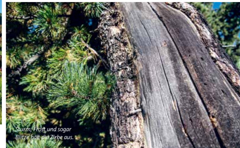
Sturm, Frost und sogar Blitze hält die Zirbe aus.