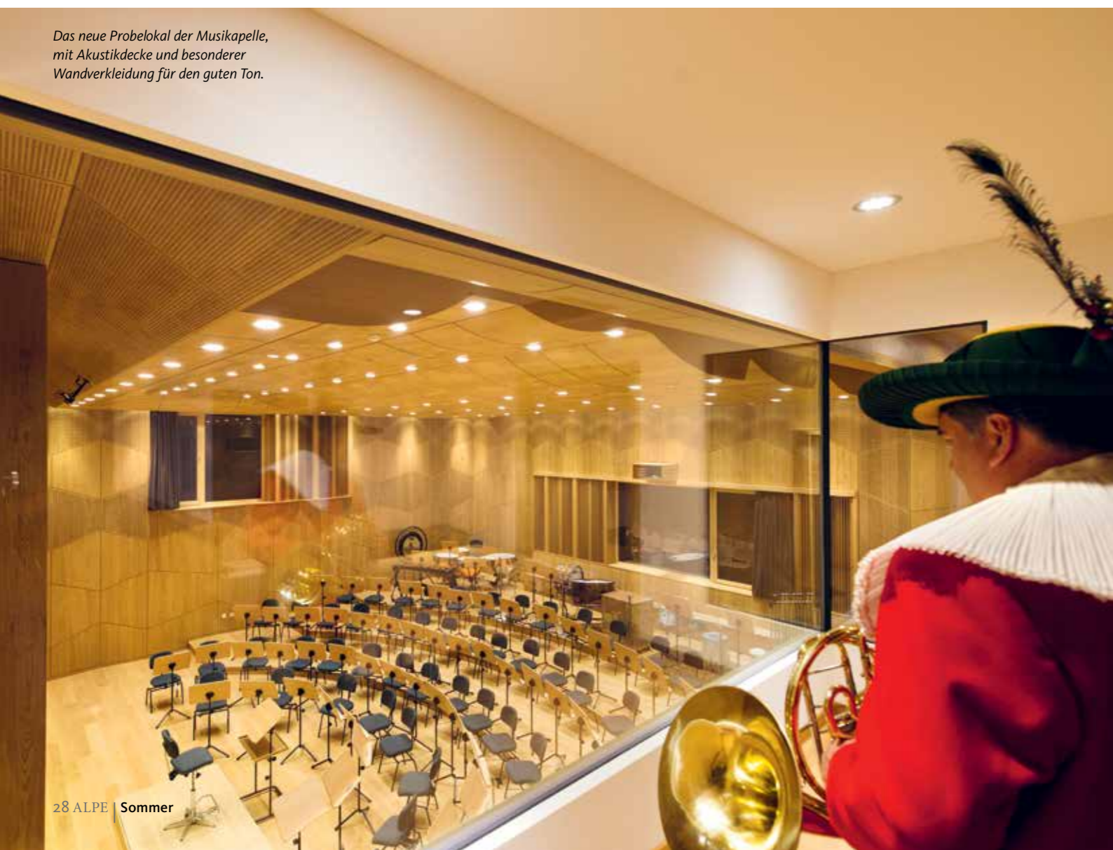
Das neue Probelokal der Musikapelle, mit Akustikdecke und besonderer Wandverkleidung für den guten Ton.