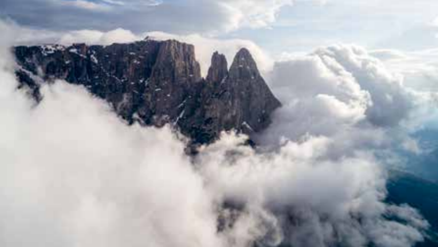
Dessen edle Blässe zeichnet das Dolomitgestein aus. So strahlt auch die Tofana in den Cortineser Dolomiten (rechts).