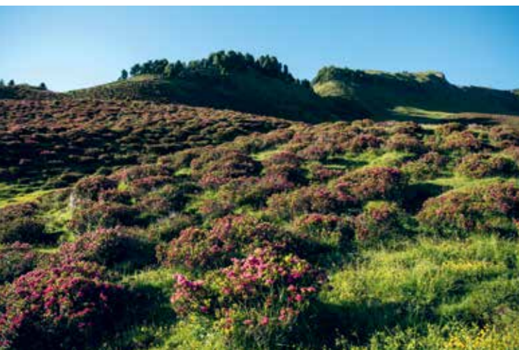
Im Hochsommer öffnen die Almrosen ihre Blüten.