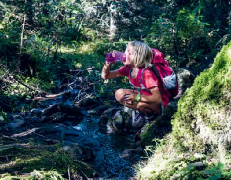
Kein Plastiktrash: Der Hexenweg bei Saltria besteht aus Naturmaterialien