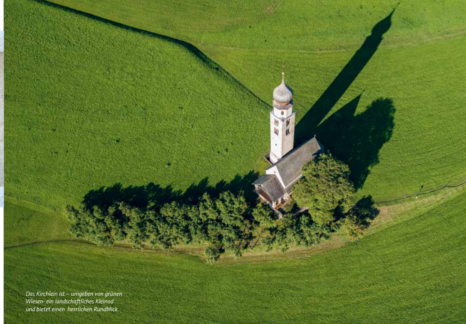
Das Kirchlein ist – umgeben von grünen Wiesen – ein landschaftliches Kleinod und bietet einen herrlichen Rundblick.

Ausflugziel. Die Lage inmitten von sattgrünen Wiesen mit dem Schlernmassiv und der Santsnerspitze im Hintergrund bringt es mit sich, dass dieses Gotteshaus zu einem der beliebtesten Fotomotive in Südtirol wurde. War es früher noch ein wichtiger Bezugspunkt für die gläubige Bevölkerung und für die umliegenden Bauersleute, so hat sich dieser Ort heute zu einem sehr beliebten Ausflugsziel entwickelt. Die Kirche kann nicht mit dem Fahrzeug, sondern nur zu Fuß erreicht werden. Bänke vor der Kirche unter einem Nussbaum, der an heißen Sommermonaten erfrischenden Schatten spendet, laden die Besucher zum beschaulichen Genießen ein. Es ist dies ein Rastplatz für die Seele, ein Kraftort zum Verweilen. «