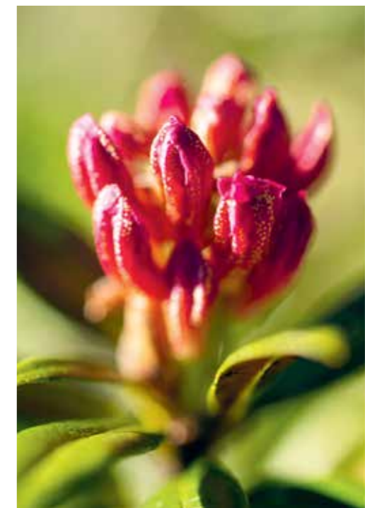
Alpenrosen sind Heidekrautgewächse und wurden früher auch als Heilmittel verwendet.

Ein Wanderparadies. Für naturbegeisterte Wanderer bleibt die Seiser Alm ein Gebiet zum Entde-