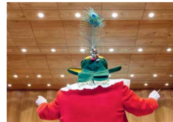
Feiner Lodenstoff, weißer Plisseekragen und grüner Hut mit Pfauenfeder gehören zur festlichen Tracht.

Die 200 Musikkapellen in Südtirol erfreuen sich glücklicherweise eines regen Zulaufs an jungen Musikern und Musikerinnen. Die gute Ausbildung in den Musikschulen, aber auch das neue, moderne Repertoire an Musikstücken gefällt jungen Menschen nach wie vor. Als Hauptkonzert der Musikapelle Kastelruth gilt seit ein paar Jahren das Josefi-Konzert im März. Das Programm ist jedes Jahr etwas Besonderes und meist einem bestimmten Thema gewidmet. Das Repertoire reicht von Marsch, Polka und Walzer über Jazz und Klassik bis zu Rock und Pop. Ein Musikgenuss für Jung und Alt. «