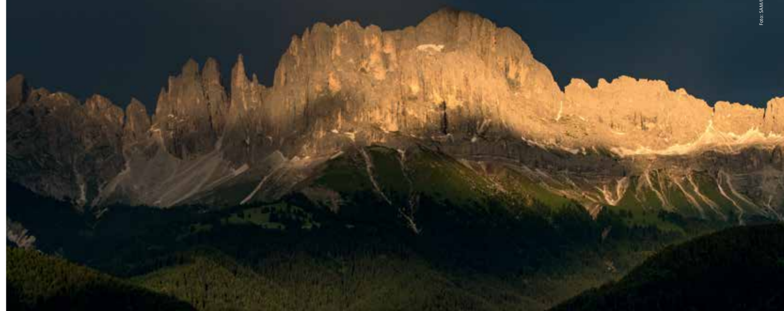
Die faszinierende Bergwelt der Dolomiten.

Vom Tourismusdienstleister des Landes, IDM Südtirol, wird bestätigt, dass Auswertungen von Internetsuchmaschinen und den sozialen Netzwerken zeigten, dass die Bekanntheit der Dolomiten, und vor allem die Berühmtheit gewisser Hotspots, in den letzten paar Jahren exponentiell gestiegen ist. Spricht man mit Zimmervermietern oder Gastwirten in der Ferienregion Seiser Alm, so haben viele das Gefühl, dass das Publikum immer internationaler werde. Wenig Freude hat man allerdings mit jenen Gästen, die nur für einen Tag anreisen, um dann von bestimmten Fotopoints Bilder in den sozialen Medien posten zu können. Im krassen Widerspruch dazu steht die echte Anziehungskraft dieser besonderen Gebirgslandschaft, die seiner Zeit auch Déodat Gratet de Dolomieu in ihren Bann zog. Der französische Geologe und Mineraloge gab den bleichen Bergen vor mehr als 200 Jahren seinen Namen. «